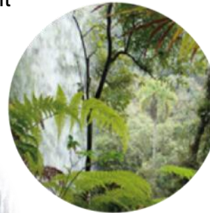
Protection and sustainable use of tropical forests