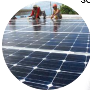
Renewable energies and energy efficiency