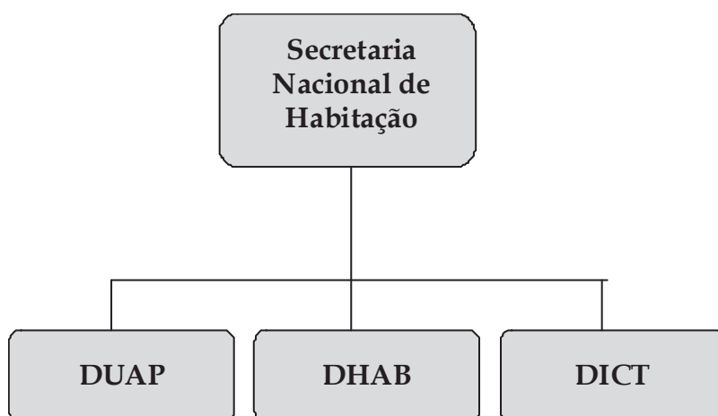
Figura 1 - Organograma Funcional da SNH

A estrutura da Secretaria Nacional de Habitação está definida no Anexo II do Decreto nº 4.665, de 3 de abril de 2003, conforme apresentado na Figura 1