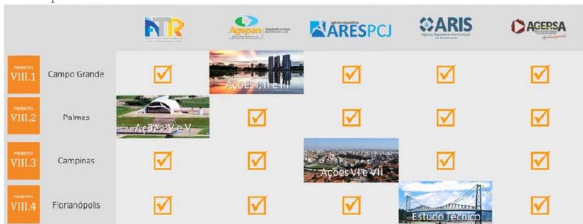
Cursos para entidades beneficiadas e sedes

A coordenação do curso ficou a cargo do CONSÓRCIO, com o apoio da Gerência de Planejamento e Regulação da SNSA/MCidades na certificação dos participantes. A Agência Reguladora Intermunicipal de Saneamento (ARIS) foi a responsável pela infraestrutura local. Os itens a seguir apresentam dados gerais do evento, objetivos, programação, palestrantes, análise da representação dos participantes e listas de presença.